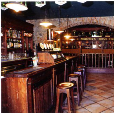
Solidità degli arredi