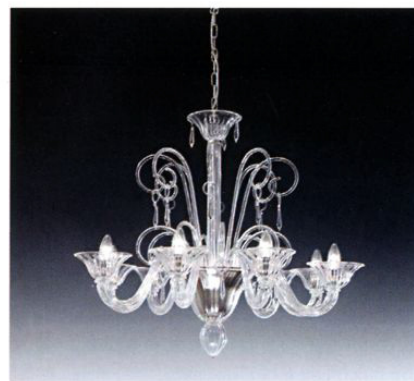
IN ALTO: UNO DEI LAMPADARI UTILIZZATI NELLA NUOVA EDIZIONE DI "BALLANDO CON LE STELLE". A SINISTRA: LAMPADA RAINBOW SOSPESA OVALE ROSSA, AMBIENTATA. QUI SOPRA: LAMPADARIO BACH 8L.

accesi di colore o trasparenti, dal design classico o creativo, ma tutti legati dalla qualità manifatturiera e dalla cura nei dettagli. La decisione di collaborare con architetti e designer di fama internazionale ha permesso di arricchire le collezioni Voltolina con prodotti dal forte impatto visivo, caratterizzati da un mood contemporaneo e da nuove ed innovative forme. Lampade, quindi, non solo per illuminare, ma anche, e soprattutto, per arredare creando atmosfere ricche di stile. E, per ultimo, il fiore all'occhiello del know-how e della tecnologia dell'azienda: il Sistema Leonardo, rivoluzionario ed unico sistema di assemblaggio creato in esclusiva per i lampadari Voltolina e che permette all'azienda stessa di entrare di prepotenza nel Gotha mondiale dei produttori di luci per ambienti. Continua anche la collaborazione di Voltolina con il mondo televisivo. Dal 10 gennaio, su Rai 1, nella nuova edizione di "Ballando con le Stelle", si possono ammirare 20 lampadari e 17 applique che illuminano la scenografia del teatro. Pezzi unici, di forte e sicuro impatto visivo, decorano con eleganza la sala da ballo più famosa d'Italia.