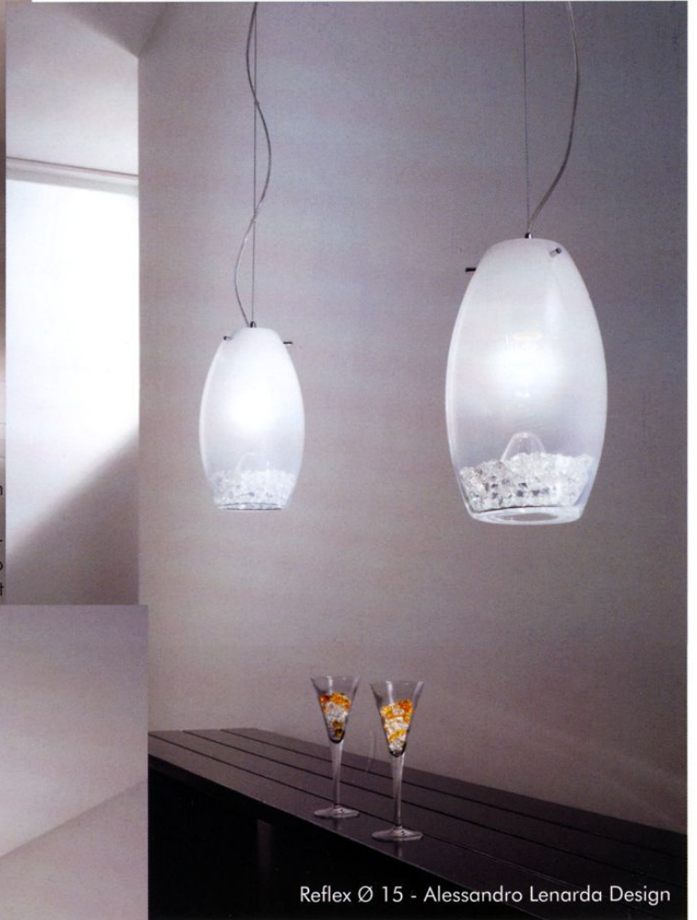
Reflex Ø 15 - Alessandro Lenarda Design

Trono e specchio sono prodotti da Sakoya - VR - in legno massello interamente lavorati a mano www.sakoya.it