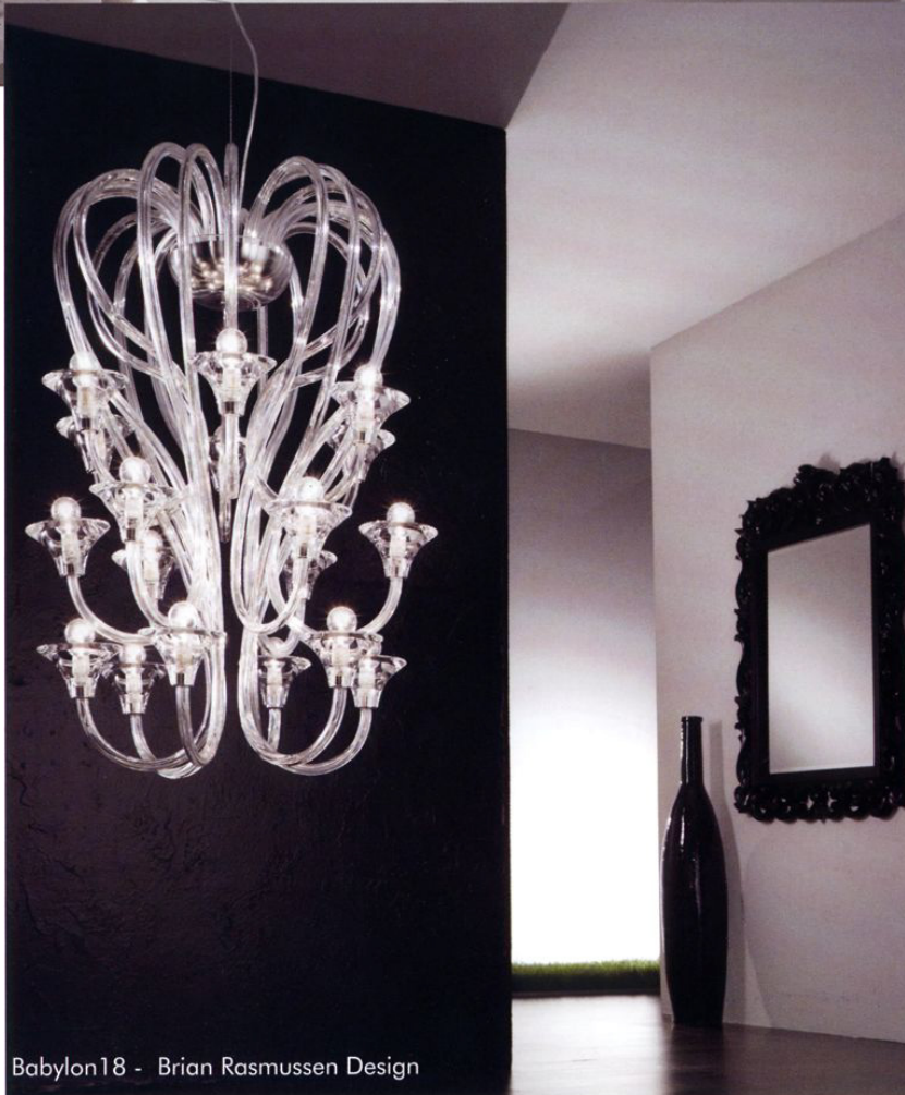
Babylon18 - Brian Rasmussen Design