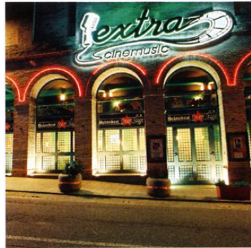
Definizione nel dettaglio