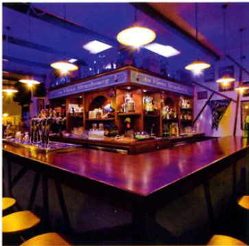
L'eleganza nel locale